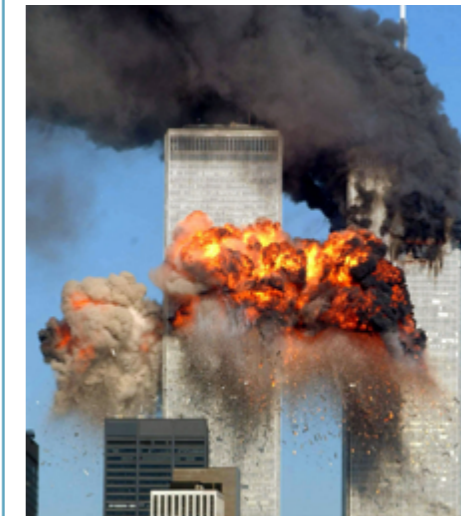
World Trade Center, New York, 11 septembre 2001

Nombreuses sont les images-témoignages dont la puissance évocatrice résume à elle-seule un événement ou un contexte historique, et qui se sont imposées comme des images d'Histoire.