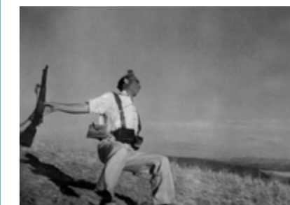
Robert Capa, « Mort d'un milicien républicain », 1936

Nombreux sont les clichés photographiques ou les séquences vidéos dont la puissance évocatrice résume à elle seule un événement ou un contexte historique.