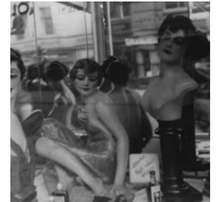
Jindrich Styrsky, « Mannequins dans une vitrine »

La ville est d'écrans et d'images : des vitrines aux panneaux publicitaires, des affiches aux vidéos, des reflets aux ombres projetées sur les murs des bâtiments.