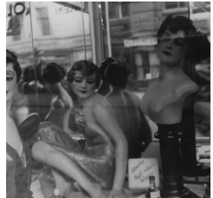
Jindrich Styrsky, « Mannequins dans une vitrine »

La ville est d'écrans et d'images : des vitrines aux panneaux publicitaires, des affiches aux vidéos, des reflets aux ombres projetées sur les murs des bâtiments.